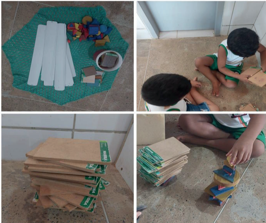
Figura 6 – Sessão 6

Nesse contexto, os objetos chamaram a atenção de duas crianças com idades de dois e três anos. Foi perceptível o interesse das crianças pelos objetos, assim que viram os materiais, assim como foi possível perceber a concentração delas em empilhar os pedaços de madeira