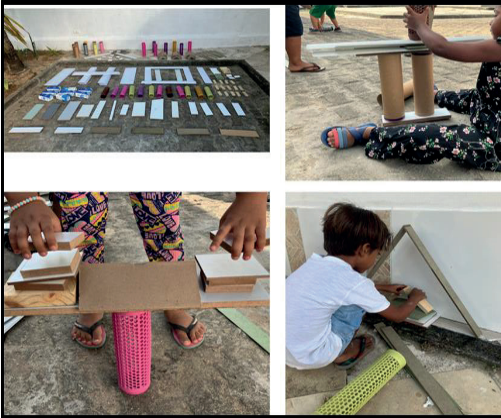
Figura 2 – Sessão 2