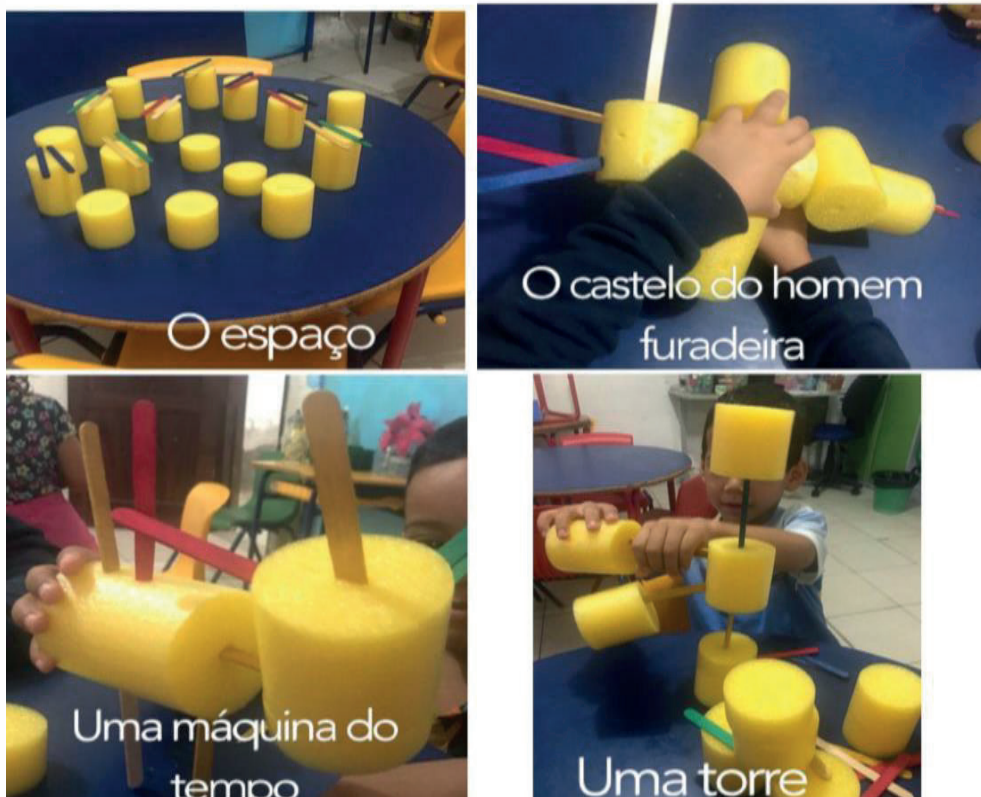
Figura 3 – Sessão 3