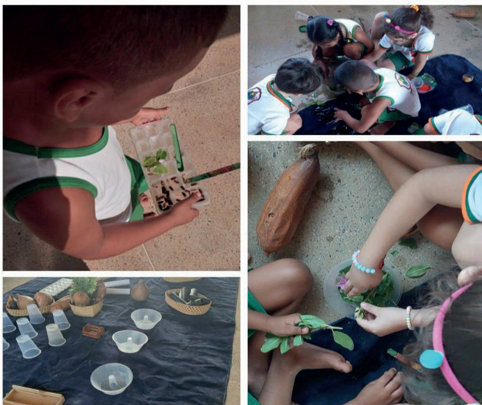
Figura 4 – Sessão 4

Sustentando o pensamento acima, podemos confirmar que o material não estruturado possibilita também a expressão dos afetos com o resgate do brincar da ancestralidade das crianças, trazendo para as suas vivências o valor cultural dessas brincadeiras. Além do mais, esse material demanda um poder de concentração maior das crianças ao pensar sobre as possibilidades de criação. Dessa forma, podemos enfatizar a importância do Brincar Heurístico no desenvolvimento dessa habilidade.