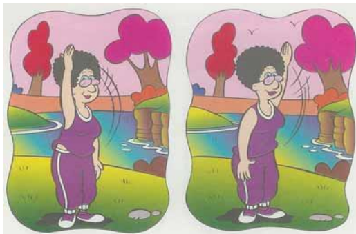
Fig.1 - Movimentos com o corpo, giros

os alunos deveriam representar por meio de desenho em uma malha quadriculada, que foi entregue aos mesmos, o movimento realizando giros: 1 volta completa, giro de 1/2 volta, giro de 1/4 da volta completa, giro de 3/4 de uma volta completa. Ver Figura 1 abaixo: