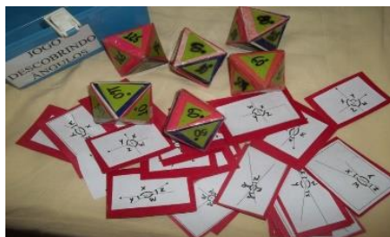
Figura 3 – Jogo Descobrimos Ângulos confeccionados pelos alunos

trios ou duplas. Cada participante na sua vez lança o dado que determina a medida do ângulo x , e deverá por meio de outras jogadas encontrar as medidas dos ângulos y , z e w . Este jogo foi baseado na sugestão de Lara (2003, p.116). A seguir imagem do jogo (FIGURA 3) confeccionado pelos alunos.