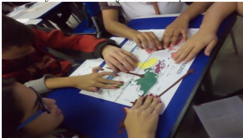
Figura 01: Estudantes cegos manuseando mapa-múndi

Neste contexto, foram feitas discussões teóricas entre a coordenadora do projeto e extensionistas a partir de: Vygotsky, Castrogiovanni, Almeida e Passini, Cavalcanti, dentre outros. Além disso, ocorriam reuniões para planejamento e produção do material tátil, como também debates sobre a utilização do material em sala, em apoio ao trabalho docente. Este material foi importante, pois aqueles com DV passaram a ter ampliação da noção de espaço e como se constituem mapas e plantas de localidades do seu cotidiano, através do uso de maquetes e plantas da sala de aula e da escola, mas ampliando-se para outros instrumentos cartográficos em escalas menores como: mapa do Brasil destacando questões agrárias, mapa-múndi (figura nº 01), outros recursos cartográficos sobre países americanos (adaptados ao livro didático) etc. Os materiais utilizados foram feitos artesanalmente, favorecendo a participação efetiva dos estudantes tutores e docentes da Educação Básica.