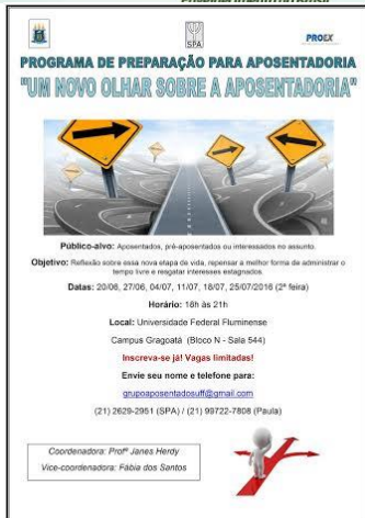
Cartaz PPA 2016