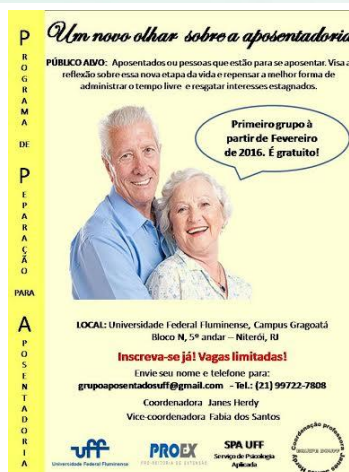
Cartaz PPA 2015