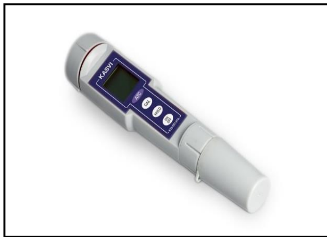
Figura 3: pHmetro portátil.

O pH foi determinado pelo método potenciométrico, com o pHmetro digital portátil da marca Kasvi, modelo K39-0014PA (Figura 3), previamente calibrado com soluções - tampão de pH 7,0 e de pH 4,0, com resultados expressos em escala logarítmica de pH. Equipamento este também utilizado para determinar a Temperatura expressa em (°C).