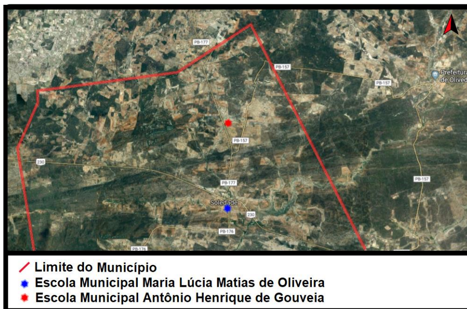
Figura 2: Mapa simplificado do município de Soledade-PB com destaque para as áreas de estudo.

As atividades foram realizadas no laboratório de Química (LQ) do Instituto Federal de Educação, Ciência e Tecnologia da Paraíba, Campus Campina Grande. As amostras de águas das cisternas foram coletadas no referido município, sendo conduzidas, posteriormente, ao laboratório de química do Instituto, para a realização das análises