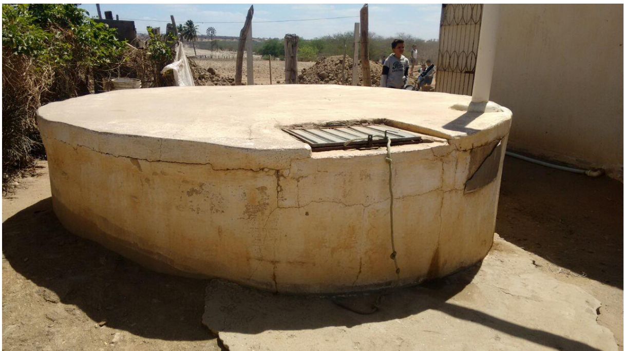
Figura 1: Reservatório da escola Antônio Henrique de Gouveia.

As águas consumidas nas escolas são provenientes de 3 reservatórios que estão localizados em comunidades próximas a cidade, um deles é o poço tubular localizado na escola Professor Luiz Gonzaga Buriti. A ocorrência de água subterrânea no Nordeste brasileiro é dada por meio de fraturas, falhas ou fissuras na rocha cristalina da região. Conforme estudos realizados por Ceballos et al (1998, 2003), a água consumida na zona rural do Estado da Paraíba apresenta elevados índices de contaminação fecal nas águas dos pequenos reservatórios. Entretanto, para os parâmetros físicos-químicos analisados, os pequenos reservatórios de água no estado da Paraíba apresentam elevados índices de sais dissolvidos. As cisternas, em sua maioria, apresentam problemas de estrutura física, além do despreparo de quem as manuseia. Por esta razão, Silva et al. 1988, relata a necessidade de um programa de manejo adequado da água, a fim de evitar a contaminação e preservar a sua qualidade na cisterna. Essas escolas apresentam em comum a mesma forma de armazenamento de água, sendo esta em cisternas de alvenaria. Porém, esses reservatórios apresentam imperfeições na sua estrutura física, como rachaduras e salitre (Figura 1), além da má localização do reservatório. Para realização da pesquisa realizamos 3 visitas in loco de 2 em 2 meses no período de fevereiro a agosto de 2017 com o objetivo de coletar as amostras de água.