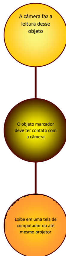
Figura 2- Passos de como a imagem é lida

Para criação e utilização da Realidade Aumentada, pode-se ver que existem alguns passos a serem seguidos e que não é tão simples quanto parece, principalmente no desenvolvimento da figura 3D, que o pesquisador ou professor terá que utilizar a criatividade para elaborar material, que não é obrigatório ser uma figura em terceiro plano, podendo também ser: Imagem, vídeos, animações, etc.