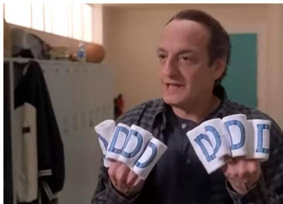
Figura 6 – Presente para os alunos do professor Matt

Próximo ao fim do filme, os alunos recebem a notícia de que o Sr. D. está internado e que ficará impossibilitado de dar aulas por um tempo e isso motiva todos os alunos e escola a prepararem homenagens ao professor no hospital. Com a última partida de basquete chegando e o medo do time coordenado pelo Sr. D. posteriormente a pedido do antigo treinador (professor Vern) não está indo muito bem, apesar de toda a motivação construída pelo professor, tanto nas vitórias, como nas perdas, os alunos recebem incentivo do professor Matt minutos antes da partida iniciar, entregando munhequeiras aos alunos com a inicial “D.” para motivar os alunos.