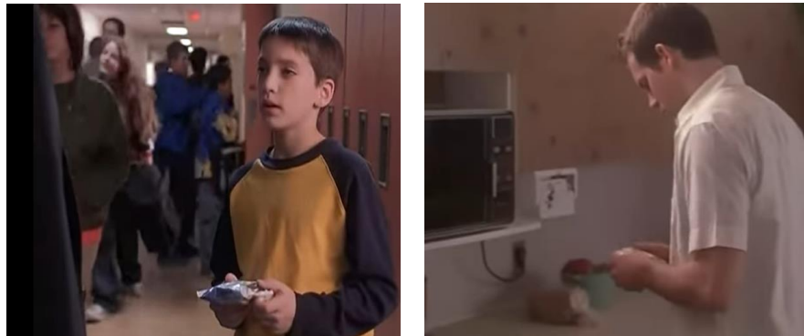
Figura 3 e 4 – Momento singular do filme