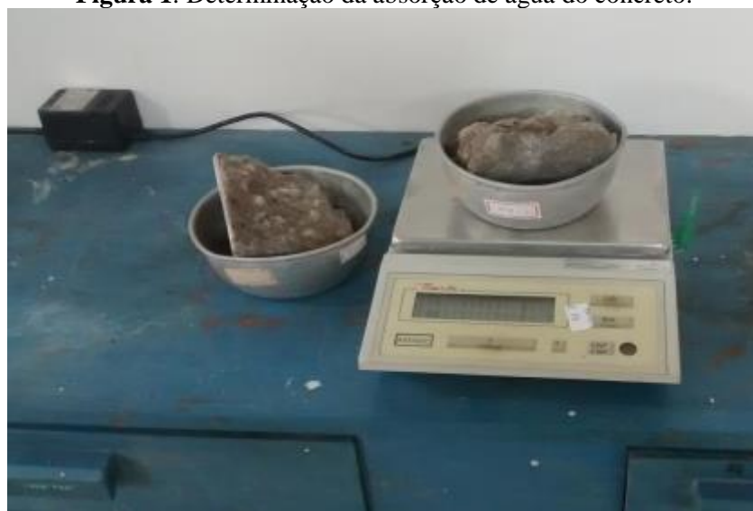
Figura 1: Determinação da absorção de água do concreto.

Os resultados obtidos são provenientes na média de 2 corpos de prova utilizados para cada teor e idade de cura.