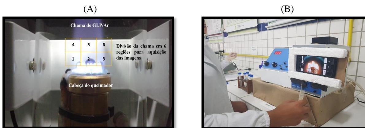
Figura 1. (A) Chama com as seis regiões escolhidas para estudo de sensibilidade na análise de Li; (B) suporte utilizado para aquisição das imagens digitais utilizando o smartphone em um suporte confeccionado com materiais de baixo custo como isopor e papelão.

Uma solução estoque (100mL) contendo 1000 \text{ mgL}^{-1} de \text{Li}^+ foi preparada a partir do sal \text{LiCl} (Vetec). A partir desta amostra, foram preparados padrões por meio de diluições utilizando tubos do tipo Falcon ® de 15,0mL. A faixa de trabalho estudada foi de 1,0 a 100 \text{ mgL}^{-1} do analítico. Para aquisição das imagens, o aplicativo Photometrix (versão 1.2.1) foi utilizado. Para mapeamento da chama, foi realizado um estudo preliminar para determinar qual o melhor ângulo de coleta da imagem, como pode ser observado na Figura 1. Um suporte confeccionado utilizando isopor e papelão e ímãs foi posicionado junto ao equipamento para permitir a aquisição das imagens mantendo sempre a mesma posição e ângulo de incidência de luz, garantindo assim a reprodutibilidade das imagens coletadas.