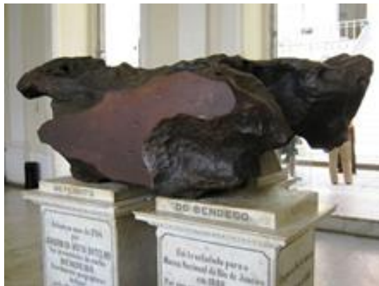
Figura 1: Imagem do meteorito que está no Museu Nacional no Rio de Janeiro.

No planeta Terra, estima-se que aproximadamente 500 meteoritos caem por ano, com dimensões suficientes para serem identificados e recuperados. O Brasil constantemente é alvo de colisões de meteoritos, um bom exemplo a ser tomado é o do Meteorito de Bendegó, encontrado na cidade Monte Santo – BA. Este é o maior já encontrado no Brasil e o 16º encontrado no mundo, mas no ano de sua descoberta tratava-se do 2º maior já encontrado (CULLITY, 1967), figura 1 apresenta fotos deste.