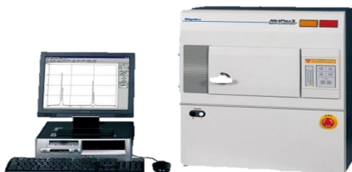
Figura 2: DRX Rigaku MineFlex II Desktop.

Para a análise química do fragmento do meteorito Bendegó foi realizada a maceração e conseguinte inserção do analito utilizando um equipamento de Difração por Raio-X (DRX Rigaku MineFlex II Desktop) do departamento de Física Teórica e Experimental da UFRN (verificar figura 2), o qual já estava devidamente calibrado e teve como objetivo a geração de cartas cristalográficas. Os dados obtidos foram processados e armazenados em formato de texto (TXT).