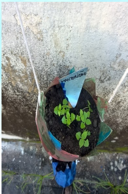
Figura 04: Manjericao após duas semanas da plantação