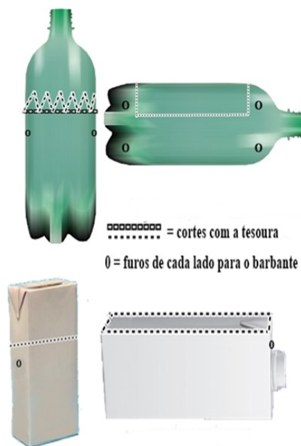
Figura 01. Modelo de cortes nas garrafas pets e caixas Tetra Pak ou Longa Vida

Após a lavagem das embalagens, os alunos foram instruídos a cortarem as garrafas e embalagens Tetra Pak ou Longa Vida (Figura 01) de forma similar para manter um equilíbrio ao pendurar. Foram feitos furos também para permitir o escoamento da água do fundo do recipiente.