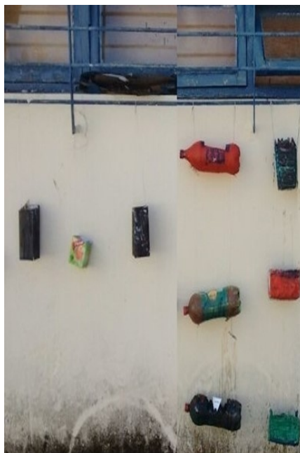
Figura 02: Diferentes pontos da horta suspensa

Foram criadas várias fileiras verticais formando a horta suspensa (Figura 02), ocorrendo o cultivo de diversos vegetais.