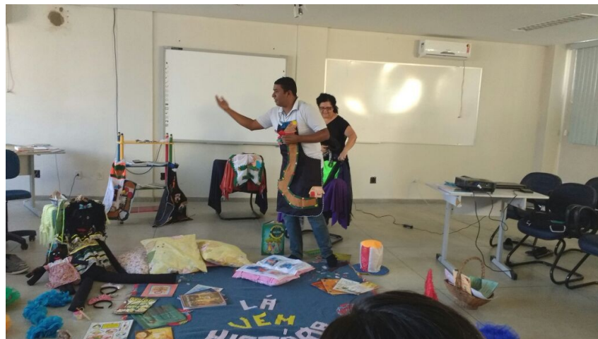
Figura 2 - Momento da Contação História

A mediação ocorrida no momento da história pode se dar através de várias formas. O avental é uma delas. Esse material expressivo permite ao contador trabalhar explorar o lugar onde a história acontece a partir de uma performance na qual o seu corpo é suporte para o cenário.