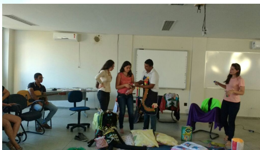
Figura 3 - Participação da Turma no Reconto da História.

A performance utilizada pelo contador precisa ser bem elaborada, pois só assim haverá uma proximidade física entre a sua ação narrativa e o ouvinte. Essa proximidade se dá pelas percepções e sensações construídas na atividade de apreciação desenvolvida pelo grupo que ouve a história. Na imagem abaixo registramos uma roda de contação de história constituída em uma atividade de itinerância desenvolvida pela Brinquedoteca em uma sala de aula do curso de pedagogia.