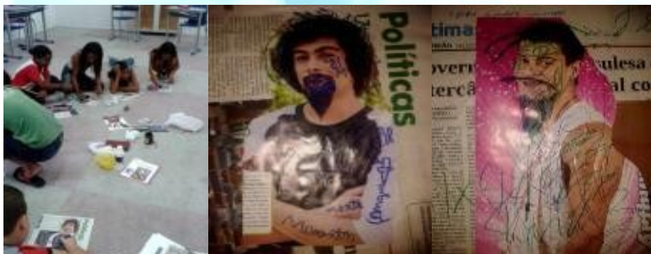
Figura 01: Trabalhos produzidos 1ª atividade prática.

Como resultado dos trabalhos produzidos, as características visuais de Rebeldia foram: uso do preto, tanto nas vestimentas quanto no corpo (maquiagem); Alguns rabiscos apresentaram a forma de rasura, sem caráter figurativo (ver Figura 01); Houve desenho de piercing e tatuagem, estas mostravam elementos negativos (escritas – monstro, morte, sangue e otários).