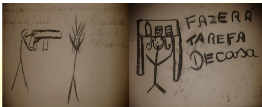
Figura 02: Desenhos de normas/regras que a rebeldia contrapõe.

Depois, foi solicitada a comunicação de Rebeldia através do desenho (ver Figura 02), produzido no papel com carvão vegetal. A atividade envolvia a identificação de normas/regras, através de duas imagens: 01. Não gosta de fazer, mas é obrigado. 02. Faz, mas não pode.