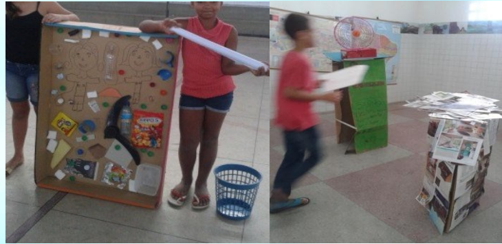
Figura 06: Obra O Lixo não é Bom/ Obra Ventilador e as Folhas.

A próxima produção fez referência ao Refeitório, este grupo também transmitiu uma relação formal direta com a obra de Ana Maria. A apresentação foi acompanhada por alguns educandos de outras turmas, merendeira e coordenadora pedagógica. Todos nos reunimos à mesa para isto. Considero importante apontar que a fome dos educandos, não foi algo concreto – o alimento/substância. No entanto, apontaram a carência do intocável: educação, limpeza e de amor. O nome da obra foi Fome de Grito (ver Figura 07).