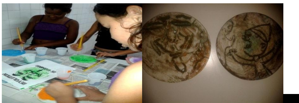
Figura 04: Produção que relaciona Isoporgravura e Rebeldia, Fonte: Acervo pessoal

Com objetivo dar representação visual às características acima de forma mais limpa e simplificada. A turma foi dividida em grupos de três. Os educandos nunca tinha vivenciado a arte dessa maneira. Em consequência do tempo, as imagens produzidas não ficaram claras, no entanto, as matrizes no isopor conseguiram representar sobre os três aspectos (personagem, ação e gestos) da rebeldia.