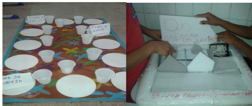
Figura 07: Obra Fome de Grito / Obra Os meninos do banheiro.

A próxima produção fez referência ao Refeitório, este grupo também transmitiu uma relação formal direta com a obra de Ana Maria. A apresentação foi acompanhada por alguns educandos de outras turmas, merendeira e coordenadora pedagógica. Todos nos reunimos à mesa para isto. Considero importante apontar que a fome dos educandos, não foi algo concreto – o alimento/substância. No entanto, apontaram a carência do intocável: educação, limpeza e de amor. O nome da obra foi Fome de Grito (ver Figura 07).