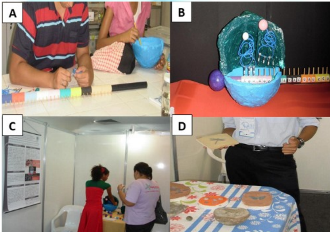
Figura 1: Estudantes produzindo o modelo de síntese de proteína (A); modelo de síntese de proteína produzido pelos estudantes (B); Estudante apresentando trabalho no XIII MOCIEC TALENTO CIENTÍFICO (C) e Modelos de fósseis apresentados no XIII MOCIEC Talento Científico (D).

A Figura 1 mostra alguns Estudantes da EEEFM Profª Olivina O. C. da Cunha, João Pessoa-PB no XIII MOCIEC – Talento Científico Jovem.