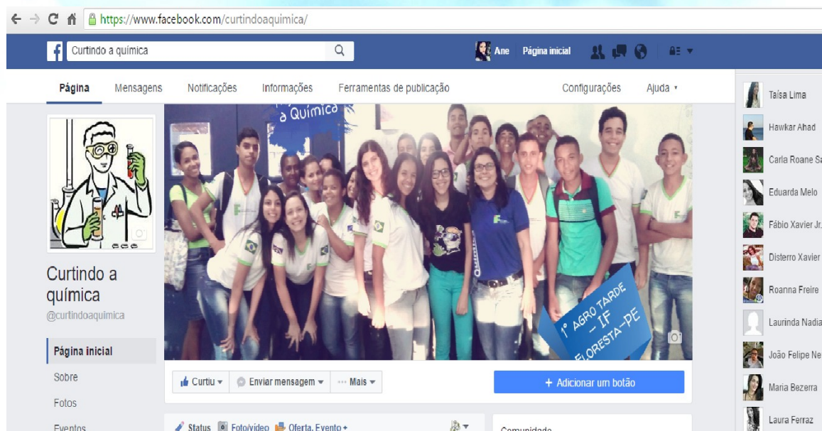
Figura 02: Página criada no Facebook - Curtindo a Química.

A página que foi criada no facebook da autora Ane Caroline, na qual possui os vídeos compartilhados pelos alunos, possui cerca de 60 curtidas e continua a ser visualizada pelos usuários da rede social, desde o dia de sua criação até os dias atuais.