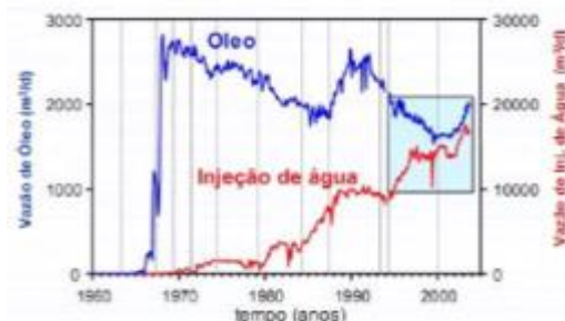
Gráfico 1. Relação do volume de óleo produzido e a vazão de água injetada em função do tempo.

Ainda com relação à alta eficiência deste método de recuperação suplementar, o gráfico 2 ilustra a resposta da produção de óleo, frente à injeção de água, de um determinado reservatório produtor na Formação Açu (Bacia Potiguar) – a curva da produção de óleo é fortemente influenciada pelo volume de água injetado neste reservatório (PREDA, 2008).