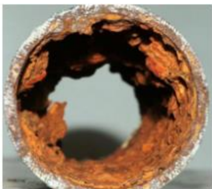
Figura 3. Corrosão em equipamento.

Furtado (2007) cita que além do teor de sólidos em suspensão (TSS) e do teor de óleo e graxa (TOG) são monitorados outros quesitos para reinjeção da água produzida, dos quais alguns até contribuindo para TSS, como: teores de O 2 e CO 2 (controle dos processos de corrosão e incrustação), teores de ácidos orgânicos (controle do souring e incrustações por carbonato de cálcio), teores de sulfatos (controle de incrustação, corrosão e acidificação do reservatório), a concentração de bactérias (controle da corrosão e incrustação por carbonato de cálcio). As diversidades dos fenômenos envolvidos e as características individuais de cada reservatório fazem com que não exista uma regra única que se possa usar para a definição dos valores ótimos de TSS e TOG.