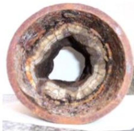
Figura 4. Incrustação em equipamento.

Para chegar ao ponto em que a água está qualificada para ser injetada no poço é necessário uma série de tratamentos durante sua passagem pela planta de processamento. A planta de processamento primário tem a finalidade de separar o gás, o petróleo, a água e outras impurezas tornando o óleo adequado para ser transferido à refinaria e a água produzida transferida para o seu devido tratamento, a fim de ser