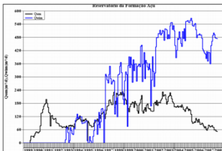
Gráfico 2. Histórico de produção de óleo ( Q_{om} ) e de injeção de água ( Q_{win} ). Valores em m^3/d .

Ainda com relação à alta eficiência deste método de recuperação suplementar, o gráfico 2 ilustra a resposta da produção de óleo, frente à injeção de água, de um determinado reservatório produtor na Formação Açu (Bacia Potiguar) – a curva da produção de óleo é fortemente influenciada pelo volume de água injetado neste reservatório (PREDA, 2008).