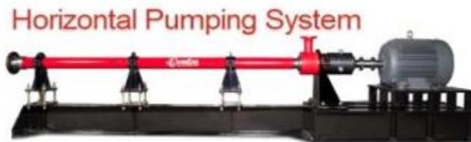
Figura 2. HPS – Horizontal Pumps System.

um motor elétrico, permitindo a transferência de fluidos, através de tubos de aço, que aumentam a pressão interna dos reservatórios e elevam os hidrocarbonetos à superfície (SILVA FILHO, 2013). A bomba HPS é demonstrada na figura abaixo: