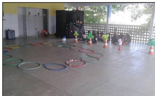
Imagem 1: preparação do ambiente para a apresentação do fantoche e para as outras atividades.

De início, acontecia o preparo do ambiente, onde os bolsistas montavam o teatro, de forma que se tornasse atrativo para as crianças e gerassem certa expectativa. A escola já provia de vários fantoches, de forma que não foi necessária a produção dos mesmos. Ao escolher os fantoches, procurávamos escolher aqueles que tinham características diferentes uns dos outros, para tentar representar a diversidade entre os alunos. Eram montados roteiros para abordar os temas desejados naquela aula, e os fantoches eram manipulados pelos próprios bolsistas. A participação dos alunos acontecia através de perguntas que eram lançadas a eles a respeito do tema trabalhado. Era notória a participação dos alunos, tendo em vista que eles se sentiam mais à vontade para interagir com os bonecos de forma mais descontraída, apresentando reação diferente a situações em que tinham contato direto com o professor e com nós bolsistas.