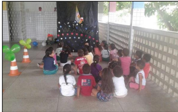
Imagem 2: Apresentação de conteúdos conceituais através do teatro de fantoches.