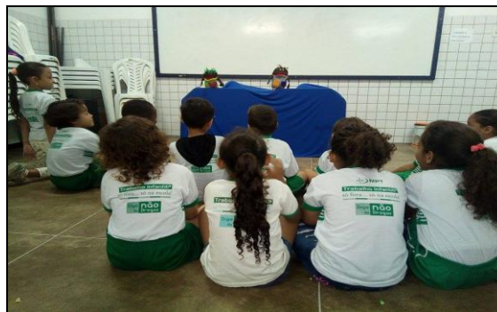
Imagem 4: Apresentação de conteúdos atitudinais através do teatro de fantoches.

Ao escolher o fantoche e da contação de história como recursos didáticos, surgiu uma dúvida em relação à aceitação por parte dos alunos, no entanto, foi muito gratificante perceber que todas as turmas demonstraram entusiasmo e participação nas apresentações.