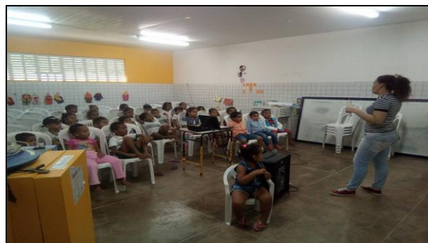
Imagem 5: Contação de história sobre o lixo.