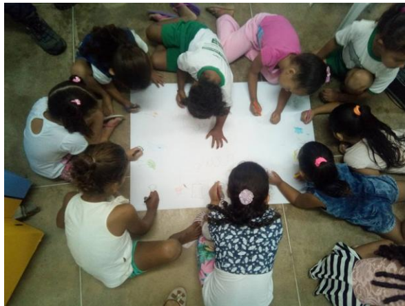
Imagem 3: atividade de desenho na cartolina após contação de história.

Como forma de avaliação sobre absorção dos conteúdos era feito um resgate constante durante as aulas, onde se era questionado sobre o que o fantoche tinha falado sobre determinado assunto, além de trabalhos com pinturas e mímicas para que eles pudessem representar o que tinham aprendido.