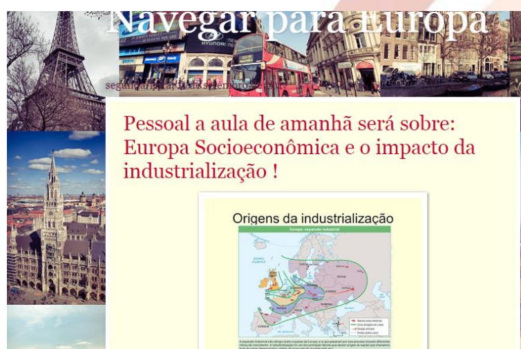
Figura 05 - Blog Passeios Pela Europa

Desse modo, foi feito algumas metodologias objetivando que a aprendizagem geográfica tornasse a ser mais significativa para o aluno. Outro recurso midiático utilizado foi um Blog com postagens de imagens do assunto, cada aluno poderia perguntar as possíveis perguntas, porém, essa metodologia não houve total participação dos alunos, pelo fato de a maioria ser restrito a internet, e outros não utilizarem o recurso da tecnologia em prol da aprendizagem, todavia, houve pontos positivos perante alguns questionamentos que surgiu. (Figura 05).