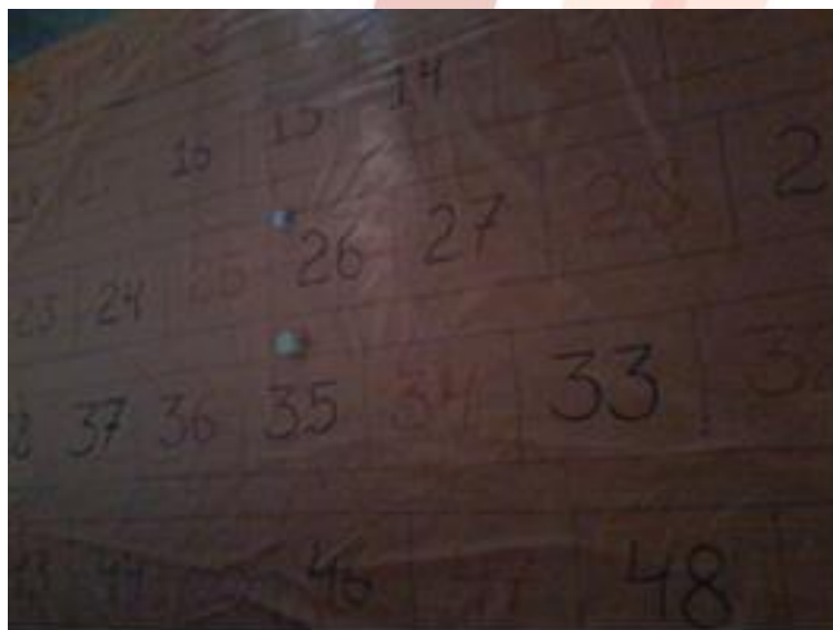
Figura 03 - Jogo x Testando o Aprendizado

Diante desse contexto, os alunos foram avaliados através de um jogo com perguntas e respostas, que relacionava com o assunto; Europa Socioeconômica, caso o aluno que respondesse a resposta certa avançava na casa, e no final o participante e a equipe ganhavam um prêmio. ( Figura 03 ).