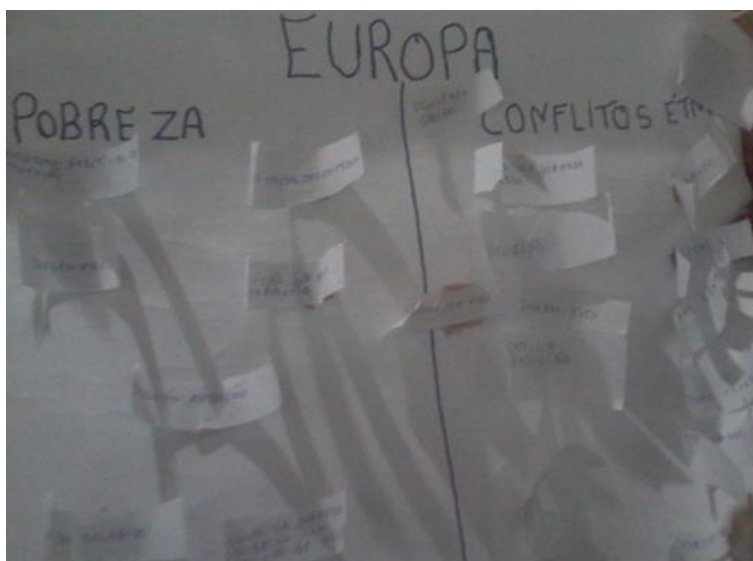
Figura 01- Dinâmica Demográfica Impactos

Deste modo, elencou-se a utilização de ferramentas metodológicas ao mediar os saberes tornando a serem elementos preponderantes para a construção da aprendizagem geográfica, e influenciando conseqüentemente, no modo como os alunos aprendem, e se sentem motivados para compreender os conteúdos geográficos no ensino fundamental. Assim, ao mediar o assunto com os educandos inserindo seus saberes prévios, envolvendo os alunos nas atividades, percebi que estimulam aos mesmos a sentirem motivação e prazer em aprender o assunto da disciplina, é uma ação metodológica que influencia de forma significativa para o educando ter mais estímulo pelo saber geográfico.