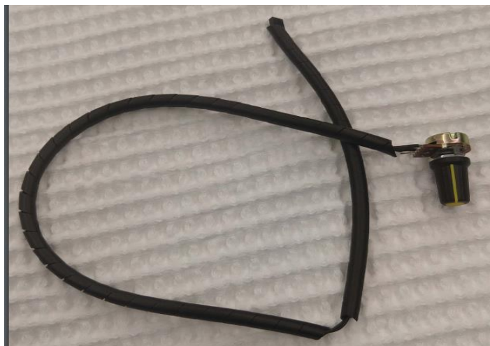
Figura 03 – Potenciômetro