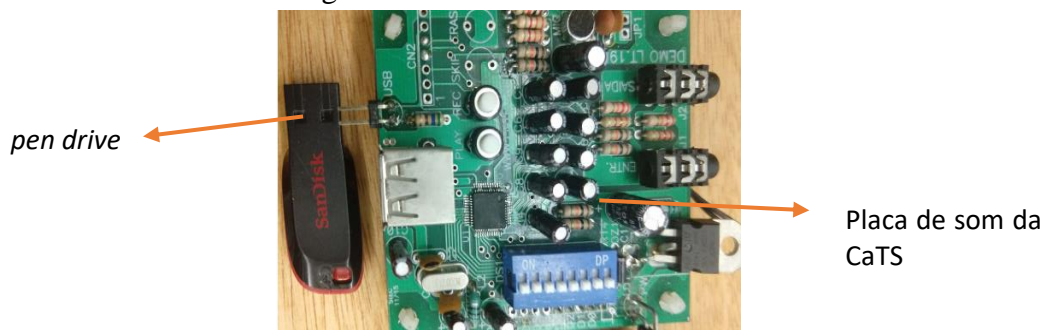
Figura 02 – Placa de som da CaTS

A partir desta premissa, possibilitaremos o uso do canal auditivo e do tato em uma única ferramenta didática. Portanto, vislumbramos que os Deficientes Visuais (DVs), através de suas críticas e sugestões possam contribuir nesta pesquisa no aprimoramento deste recurso didático especializado para educação inclusiva. Por conseguinte entendemos que somente os DV podem validar um produto de TA didático para seu uso no cotidiano escolar. Contudo o texto explicativo sobre biomas brasileiros foi previamente gravado em pen drive pelo professor, cuja voz permitirá que o aluno deficiente visual tenha acesso ao conhecimento do tema, conforme demonstra a figura nº 02 (dois). Durante a exploração tátil do mapa, o aluno identificará através dos "pontos sonoros" a localização da região e bioma a ser estudado ver figura nº 03 (três).