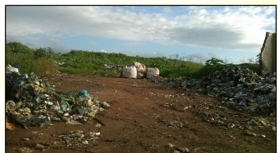
Figura 01: A presença de fumaça