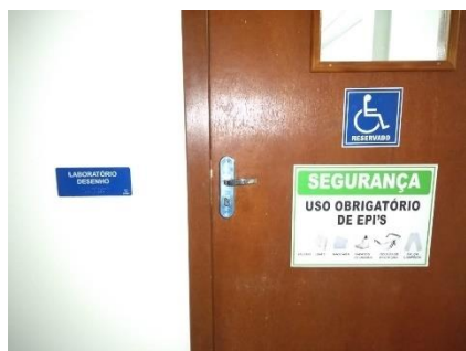
Figura 1 - Porta de acesso à sala de desenhos (atelier de projetos)