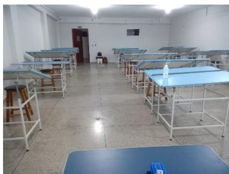
Figura 3 - Sala de desenho (atelier de projetos)

Observa-se que o layout no mapa de risco foi realizado de forma genérica, com cadeiras convencionais não apropriadas para uma sala de desenho, no entanto, a execução do layout se deu de forma diferente e pode ser vista conforme a figura 3 abaixo.