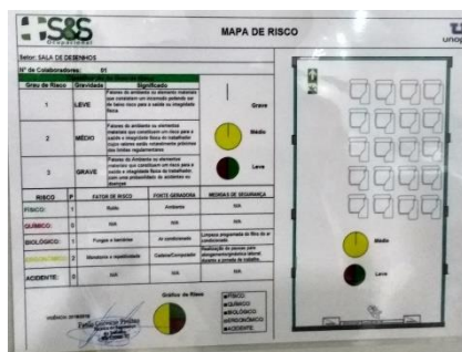
Figura 2 – Mapa de risco da sala de aula (atelier de projetos)

Observa-se que o layout no mapa de risco foi realizado de forma genérica, com cadeiras convencionais não apropriadas para uma sala de desenho, no entanto, a execução do layout se deu de forma diferente e pode ser vista conforme a figura 3 abaixo.