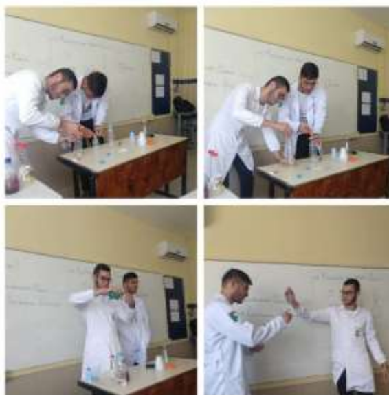
Figura 02: Realização dos experimentos.

No encontro , momento onde realizamos as práticas experimentais (Figura 02), a fim de testar as hipóteses iniciais. Os estudantes foram ativos durante a atividade, sempre participando através de questionamentos e levantando hipóteses com base na explanação realizada anteriormente.