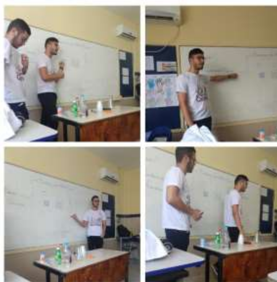
Figura 1: Explanação do Conteúdo.

No investimento , fizemos uma explanação dos conteúdos acerca das transformações da matéria (Figura 1), evidenciando que toda a mudança de estado físico é um fenomeno físico, pois não houve mudança da matéria. Também citamos exemplos cotidianos onde podemos observar esses fenomenos.