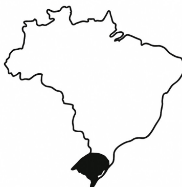
Figura 1 - Localização, em preto, do estado do Rio Grande do Sul, onde localiza-se a PIBID - SVS e a escola foco deste estudo.

A pesquisa caracteriza-se como qualitativa e descritiva, desenvolvida a partir de análise documental e observação participante. O estudo foi realizado no primeiro semestre de 2025, com oito bolsistas do PIBID, juntamente com a professora da escola que é supervisora do programa. A principal fonte de análise foi o Projeto Político-Pedagógico da da escola participante do PIBID, a qual localiza-se no município de São Francisco de Assis, no estado do Rio Grande do Sul (Figura 1). durante as atividades do PIBID, complementado por registros de campo e relatos de experiências vivenciadas na escola.