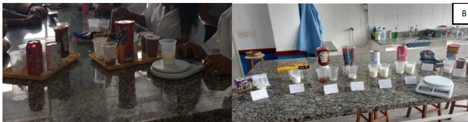
A - Quadro com indicativo de açúcar em embalagens.