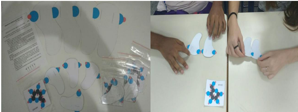
Figura 2: Modelo de Amido

Para encerrar a aula 1, foi lançada a pergunta “Quais carboidratos vocês consomem na dieta alimentar?”, para a construção de uma atividade extra-classe - preenchimento do Quadro de Resumo da dieta semanal.