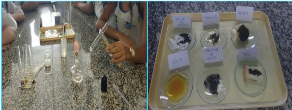
Figura 4: Prática de identificação de glicose e amido

A - alunos realizando a prática de identificação de glicose.