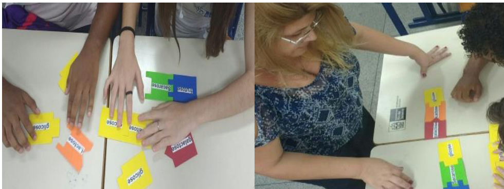
Figura 1: modelos de monossacarídeos

A dinâmica construída na prática introduziu o questionamento sobre o papel das enzimas digestivas, que foi utilizado como tema para pesquisa. Como resultado, os alunos perceberam que, no trato digestivo, os carboidratos são transformados em moléculas menores, por ação de enzimas, para serem absorvidos nas microvilosidades do intestino delgado, na forma de monossacarídeos.