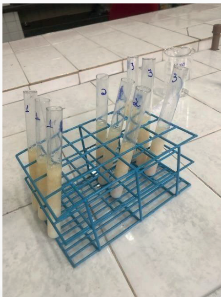
Figura 3 - Identificação de hidróxido de sódio