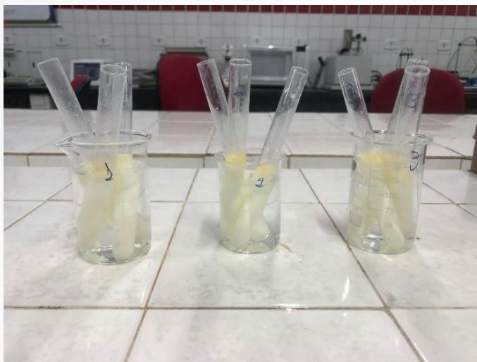
Figura 2 - Identificação de amido

densidade do leite, o que é um bom sinal em relação à qualidade. Se o leite contiver amido e bicarbonato, pode ser um sinal de que houve adulteração para restaurar a densidade ou esconder a baixa qualidade.