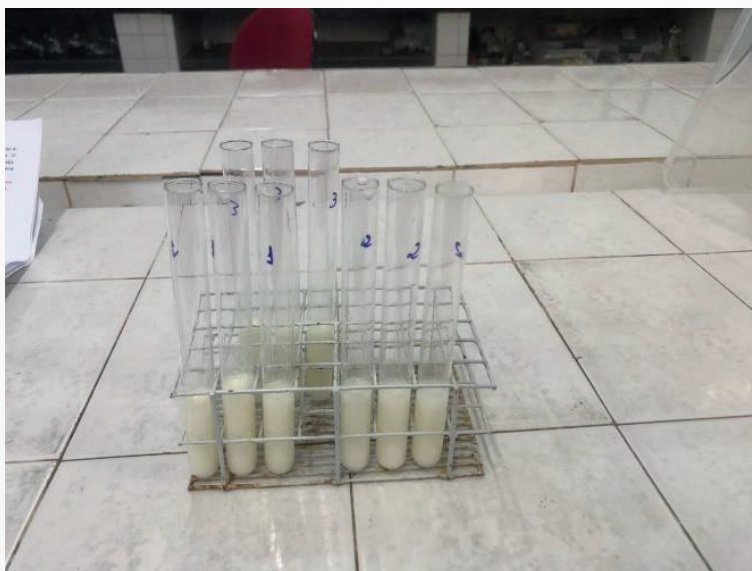
Figura 5 - Identificação de cloros e hipoclorito