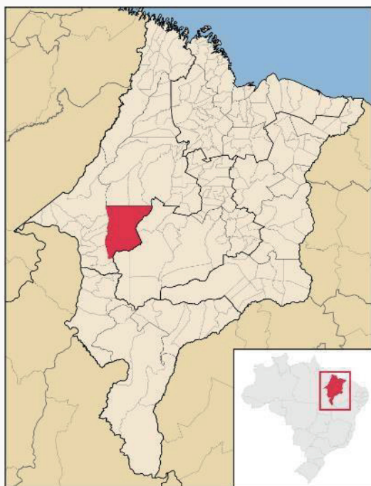
Figura 1 - Mapa do estado do Maranhão, com destaque para a cidade de Amarante do Maranhão

alimentar, esta pesquisa busca promover a popularização da ciência, aproximando o conhecimento acadêmico da realidade vivenciada pela comunidade local. A divulgação dos resultados em linguagem acessível e o diálogo com produtores e consumidores visam ampliar a conscientização sobre os riscos do consumo de leite não pasteurizado e estimular práticas mais seguras de produção e comercialização.