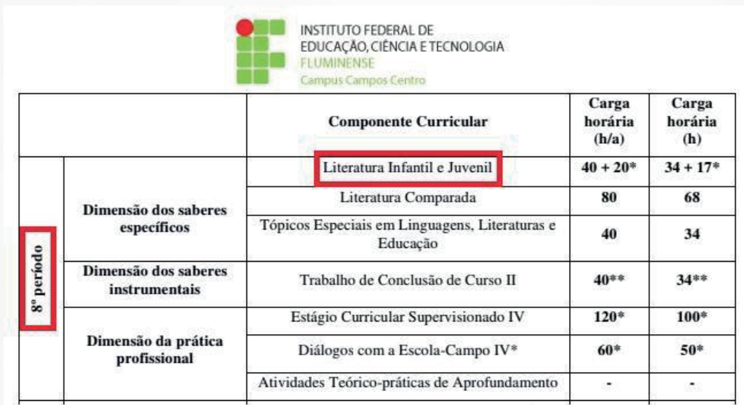
Figura 1 – Matriz Curricular do Curso de Licenciatura em Letras – Português e Literaturas

A Literatura Infantil e Juvenil é ofertada no oitavo período do curso. A Figura 1 apresenta o recorte da matriz deste último período de Licenciatura em Letras: