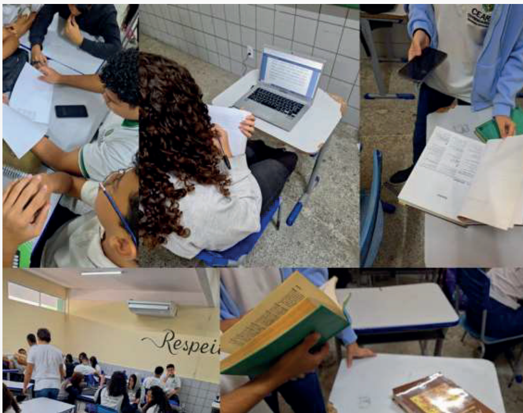
Figura 3: Pesquisa em livros e sites oficiais sobre a pergunta norteadora.

Neste momento, a missão deles era a de executar um processo de pesquisa bibliográfica em fontes confiáveis para construir as hipóteses elaboradas por eles para responder a problematização proposta. Disponibilizamos livros didáticos e acadêmicos de Biologia, de notebook com acesso à internet além de dar dicas de sites confiáveis de pesquisa como da Sociedade Brasileira de Imunizações, Sistema Único de Saúde, Organização das Nações Unidas, Fundação Oswaldo Cruz, Sistema de Saúde do Estado do Ceará, etc. Os alunos executaram suas pesquisas e pontuaram suas observações nas fichas (Figura 3). Após esse momento finalizamos as atividades do segundo encontro.