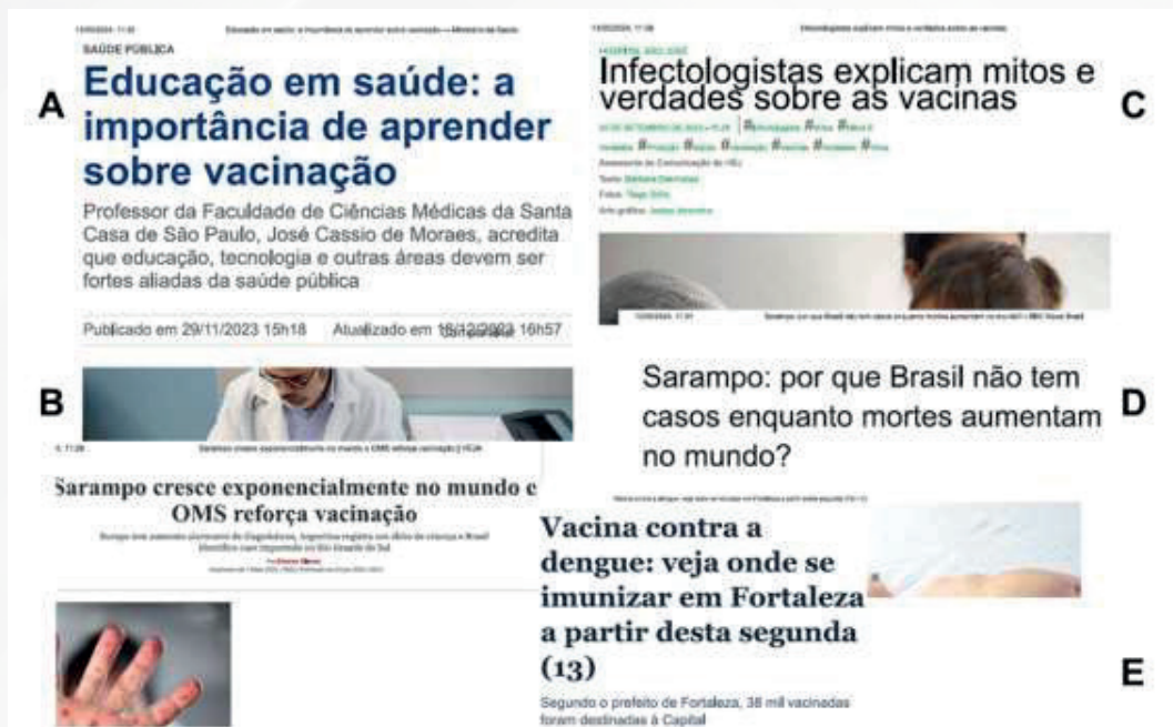
Figura 1: matérias de jornal utilizadas como textos motivadores para a sequência didática