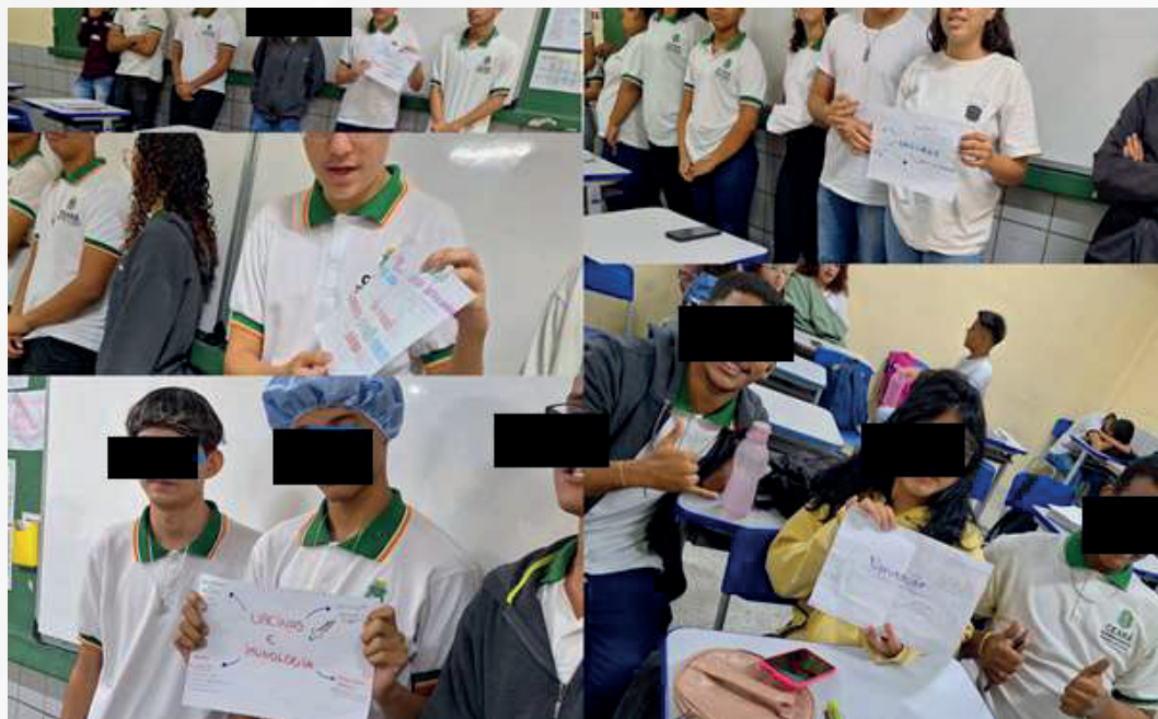
Figura 5: Apresentação dos mapas conceituais pelos estudantes.