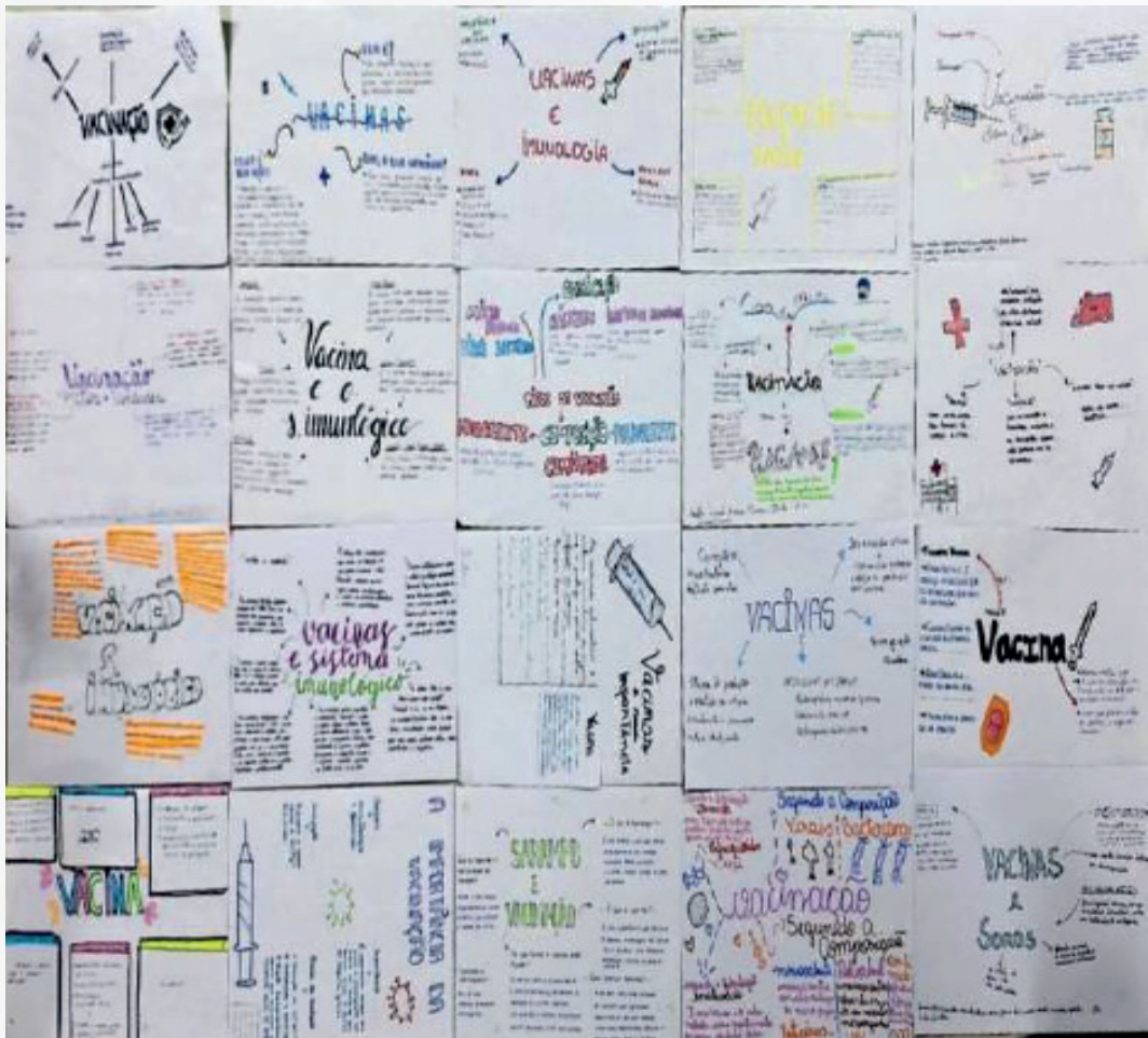
Figura 4: mapas conceituais produzidos pelos estudantes.