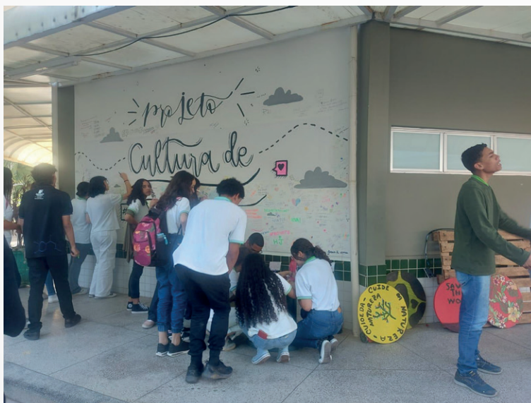
Figura 5- Mural da Cultura de Paz