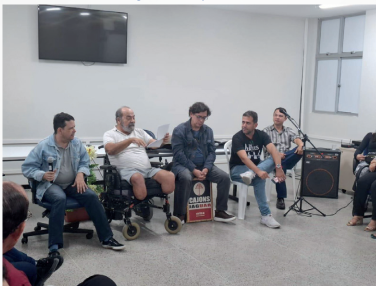
Figura 8 - Papo a Trois

aponta que o desenvolvimento da inteligência emocional possibilita o autocontrole, que é o mecanismo que permite a contenção dos impulsos e da excitação, conduzindo o indivíduo à paciência. Então, pontua-se que o autocontrole e os demais pilares da inteligência emocional (autoconsciência, empatia e habilidades sociais) também conduzem à cultura de paz.