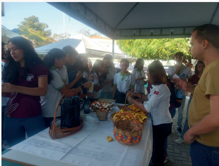
Figura 4 - Acolhimento dos estudantes no Café com Afeto