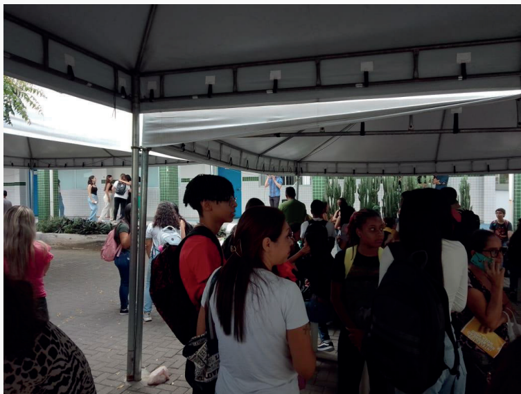
Figura 6 - Recepção dos estudantes ingressantes do ano letivo de 2024

A instituição compreende que o acolhimento dos ingressantes e seus respectivos familiares contribui para a integração entre a equipe escolar e os estudantes, fomentando a autoestima e a criação de laços de apoio social, necessários para uma convivência saudável e pacífica.