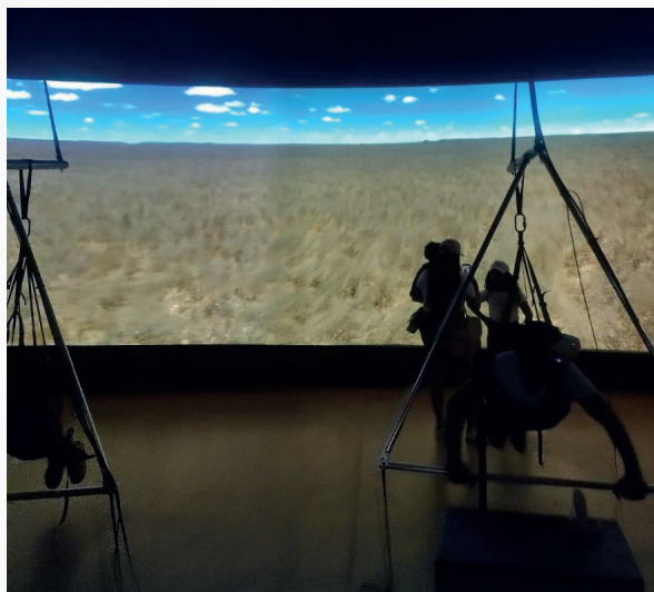
Figura 3 - Visitante realizando a simulação de voo de asa delta.