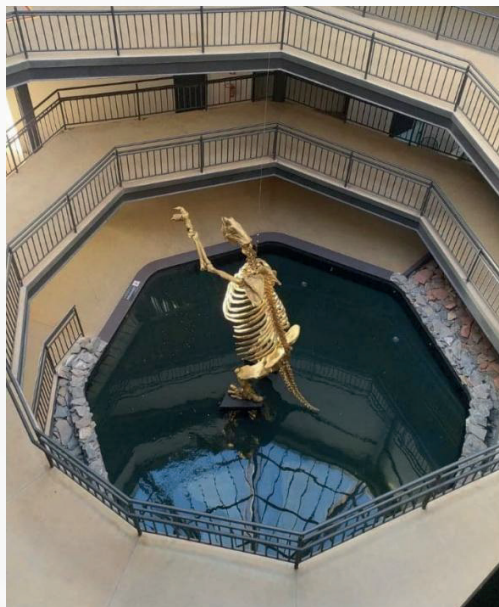
Figura 5 - Preguiça gigante da megafauna