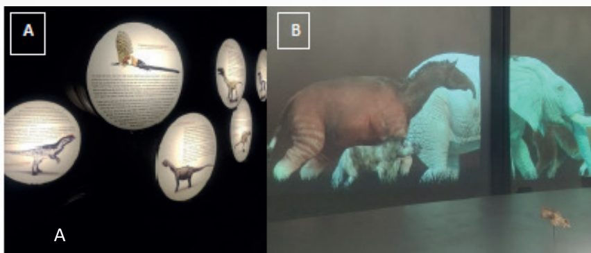
Figura 4 - [A] Registro sobre a evolução dos dinossauros até sua extinção [B] Sala do Desfile Animal