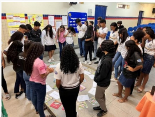
Fotos 4 e 5 – Roda de Conversa com representantes do STR Floresta

Margaridas, bandeiras de luta e suas conquistas; Políticas Públicas para Trabalhadores(as) Rurais; História da Sindicato de Trabalhadores Rurais de Floresta; Agricultura Familiar e Sustentabilidade; Reforma Agrária e Movimento Sindical de Trabalhadores; e, por fim, Trabalhadoras Rurais (MSTTR), com o auxílio de dinâmicas de grupo e exposição oral - a referida atividade contou com a participação ativa dos estudantes.