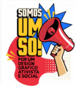
Fig. 1 - Logomarca elaborada pela designer gráfica Camila Cahú

Somado ao posicionamento crítico de Frigotto, a filósofa brasileira Marilena Chauí sinaliza que a atual configuração do Ensino Médio implica o jovem assumir “o discurso meritocrático e a perspectiva de ser um empreendedor de si mesmo” (CHAUÍ, 2022), constatação esta que vem sendo propagada no chão da escola pernambucana, por intermédio dos Itinerários Formativos da Formação Técnica Profissional, especificamente nas trilhas Empreendedorismo Técnico e Empreendedorismo FIC ou pela Unidade Curricular Projeto de Vida e Empreendedorismo, referendados pelo Currículo do Ensino Médio de Pernambuco.