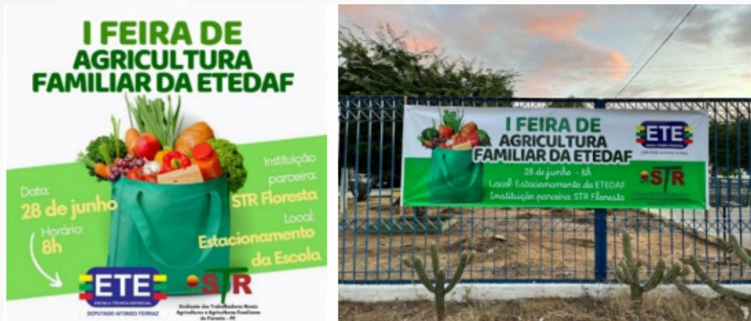
Fig. 6 – Card de divulgação da culminância e Foto 10 – Faixa de divulgação da culminância exposta no muro da escola (acervo do autor)

Outro aspecto que merece relevo concentra-se na organização do espaço para o dia da culminância - professor e estudantes elaboraram um mapa com as devidas localizações das barracas e definiram as equipes que acompanhariam cada uma delas. No dia do evento, ornamentaram o espaço, montaram as barracas, adesivaram os produtos com os stickers, fixaram os banners e conduziram a locução e ambientação sonora. Durante a culminância, os estudantes deram apoio irrestrito às trabalhadoras na comercialização dos produtos, no recebimento de pagamentos e na devolução de troco, cooperando diretamente na gestão das vendas.