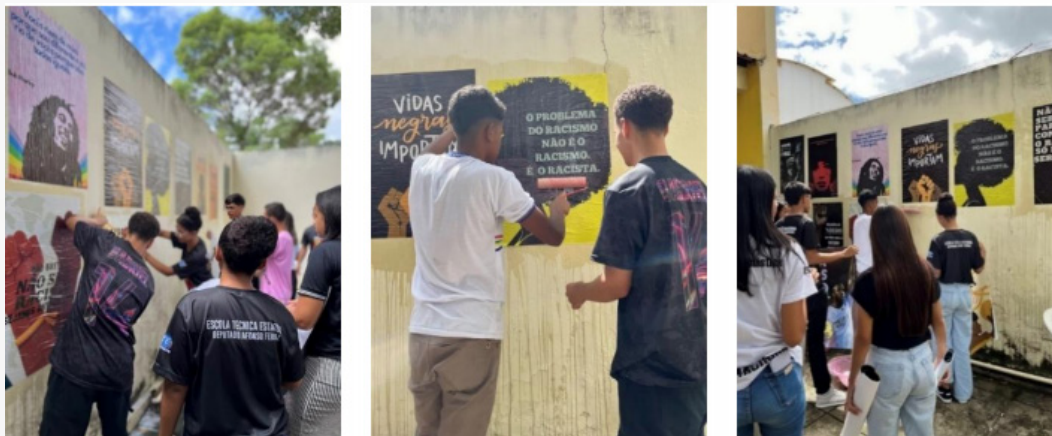
Fotos 1, 2 e 3 – Aplicação de lambe-lambes na parede interna da ETEDAF

O segundo produto final se debruçou na construção coletiva da I Exposição de Lambe-Lambes Antirracistas da ETEDAF, inspirados em leituras decoloniais, que auxiliaram a reflexão sobre o racismo e as práticas coloniais ainda presentes no cotidiano brasileiro. Para tal intuito, foram compartilhados fragmentos textuais das obras Memórias da Plantação: Episódios de Racismo Cotidiano (Grada Kilomba), O Pacto da Branquitude (Cida Bento) e Pequeno Manual Antirracista (Djamila Ribeiro). É preciso ressaltar que os lambe-lambes foram criados em dupla, em software de criação de produtos de comunicação visual, a partir de um tema de preferência dos estudantes que estivesse em sintonia com as leituras indicadas. Impressos em gráfica profissional, foram aplicados artesanalmente em parede interna da escola, por meio da utilização de materiais como balde, água, cola branca escolar líquida e rolo de espuma para pintura.