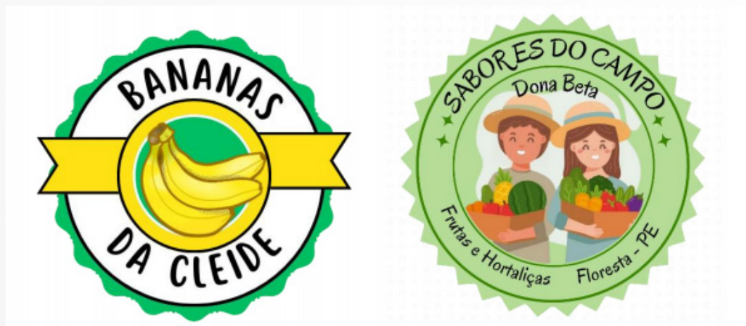
Fig. 4 e Fig. 5 – Logomarcas criadas pelos estudantes

Findado o processo criativo, as peças gráficas foram submetidas à apreciação/alteração/ aprovação das trabalhadoras, tendo em vista que o conforto, o interesse e a satisfação destas em relação ao material gráfico desenvolvido era uma prioridade. Em seguida, com a concessão do aval, os estudantes aplicaram as logomarcas em banners e stickers (adesivos personalizados), impressos em gráfica profissional, para cada participante fazer uso na I Feira de Agricultura Familiar da ETEDAF, bem como nas ocasiões de exposição de seus produtos em feiras.