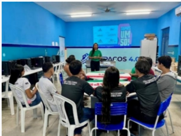
Fotos 6 e 7 – Aplicação de briefing com Trabalhadoras Rurais

O briefing serve como um documento de referência, desde o início até o fim do projeto. Nele são listadas todas as pessoas que servem de fonte de informação e que podem ser consultadas durante o projeto; além disso, são apresentadas informações sobre os objetivos do projeto, sobre o cliente, sobre o projeto em si e sobre as estratégias de design (VIEIRA; BERNARDES, SILVA, 2014, p. 100).